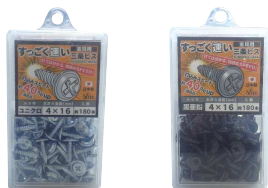
パッケージ形態 ジャストパック